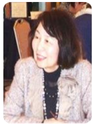
スピーチコンテスト委員会