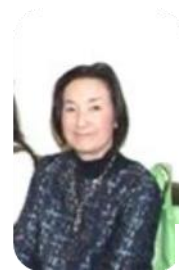
広報・渉外委員会